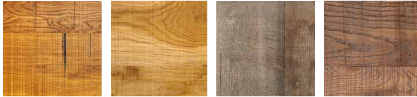
OLIATO VERNICIATO *

La vernice che utilizziamo è all'acqua, a basse emissioni di sostanze organiche volatili (VOC). Essa crea una patina superficiale sul legno che ha la funzione di ricreare particolari effetti di colore, proteggendo la superficie. We use water paint with low emission of volatile organic compounds (VOC). The paint creates a patina on the wood that results in special color effects and protects the surface.